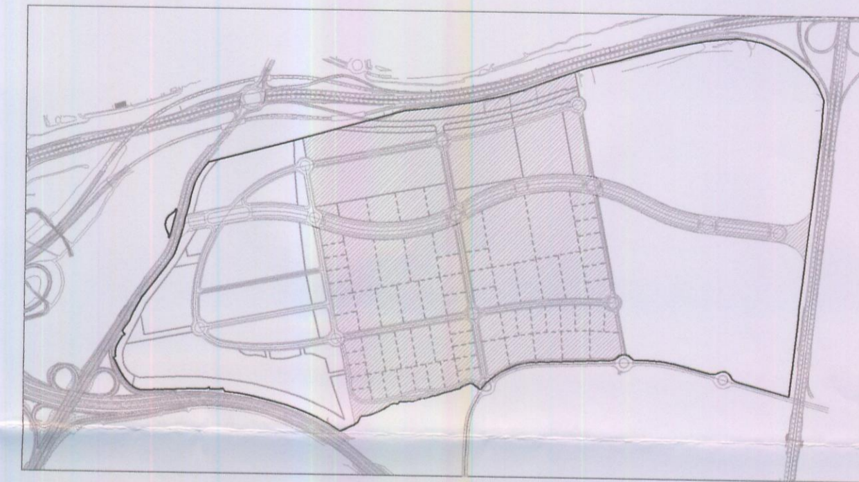
SECTOR 2/Centro DE LA 2ª ETAPA DEL PLAN DE SECTORIZACIÓN "Autovía de Toledo Norte"