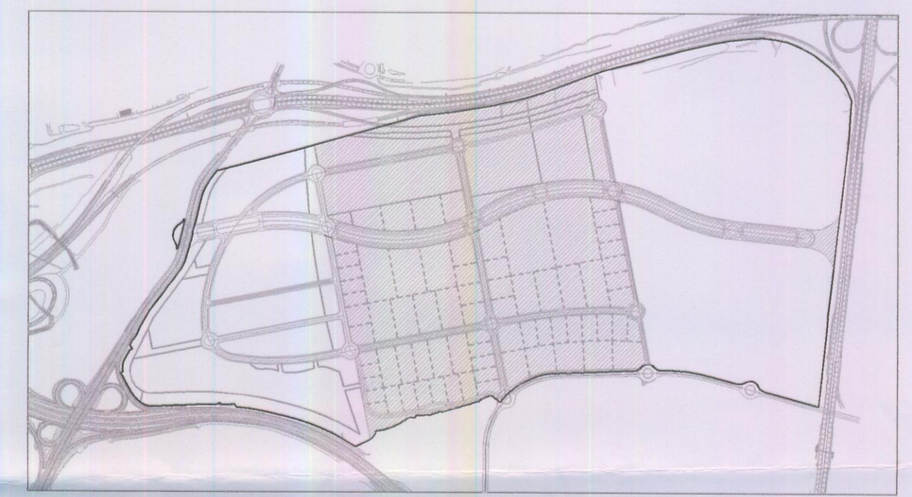
SECTOR 2/Centro DE LA 2ª ETAPA DEL PLAN DE SECTORIZACIÓN "Autovía de Toledo Norte"