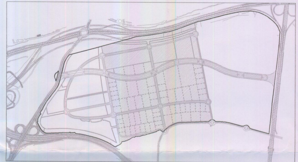
SECTOR 2/Centro DE LA 2ª ETAPA DEL PLAN DE SECTORIZACIÓN "Autovía de Toledo Norte"