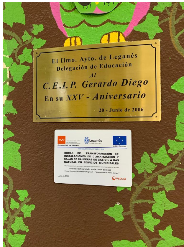
C.E.I.P. GERARDO DIEGO

PROYECTO COFINANCIADO POR LA UNION EUROPEA (FEDER)