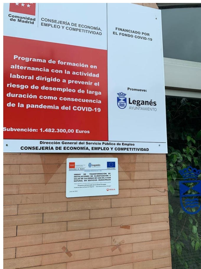
CASA DEL RELOJ

PROYECTO COFINANCIADO POR LA UNION EUROPEA (FEDER)