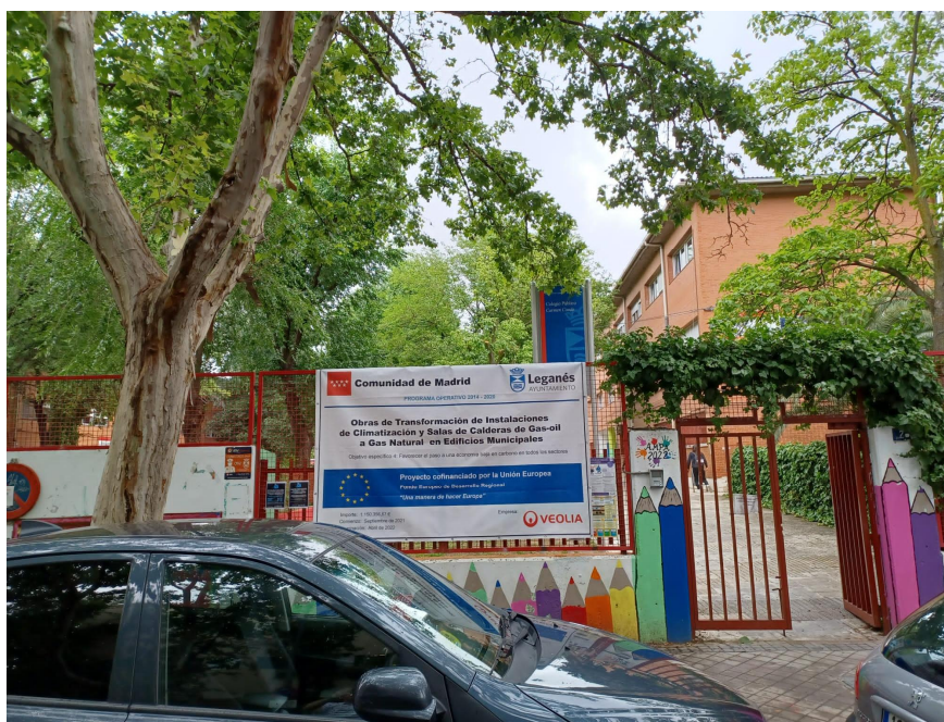
C.E.I.P. CARMEN CONDE