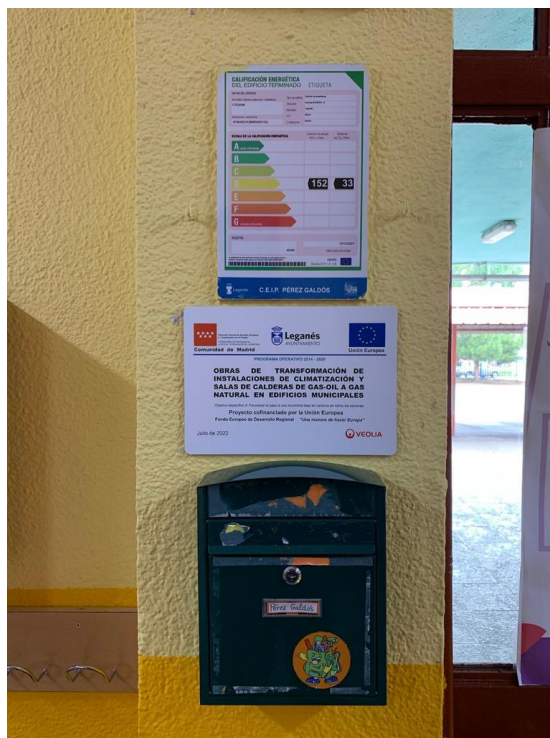
C.E.I.P. BENITO PEREZ GALDOS