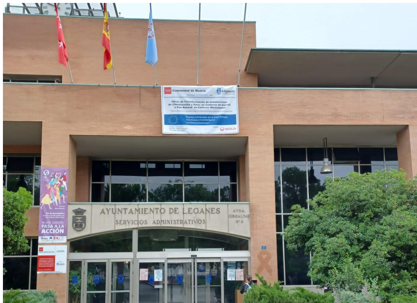
CASA DEL RELOJ