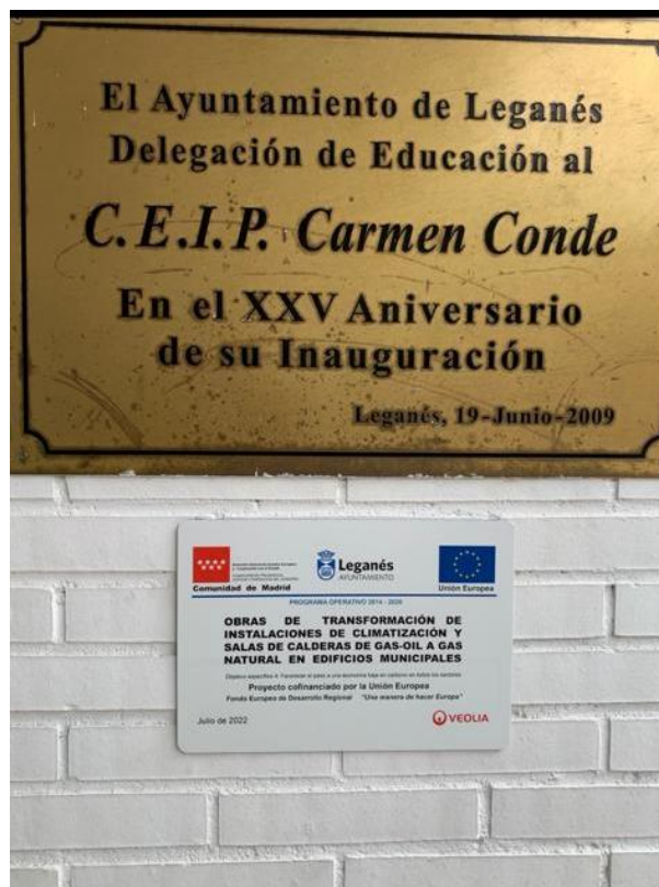
C.E.I.P. CARMEN CONDE

PROYECTO COFINANCIADO POR LA UNION EUROPEA (FEDER)