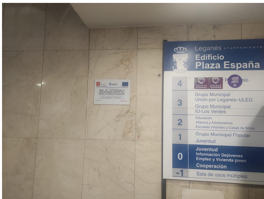
D.M. PLAZA DE ESPAÑA

PROYECTO COFINANCIADO POR LA UNION EUROPEA (FEDER)