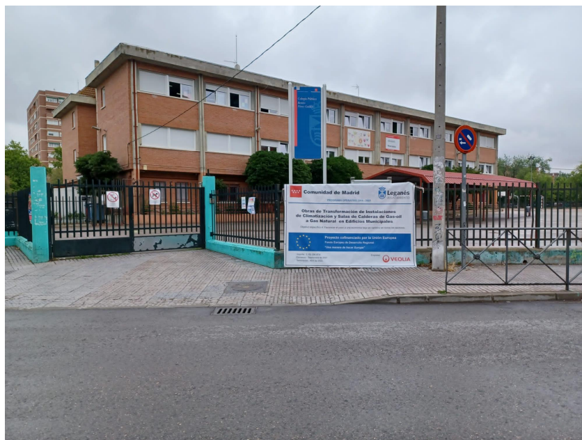
C.E.I.P. BENITO PEREZ GALDOS