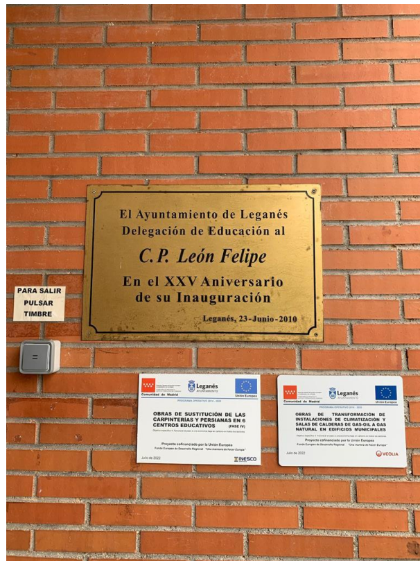
C.E.I.P. LEON FELIPE

PROYECTO COFINANCIADO POR LA UNION EUROPEA (FEDER)