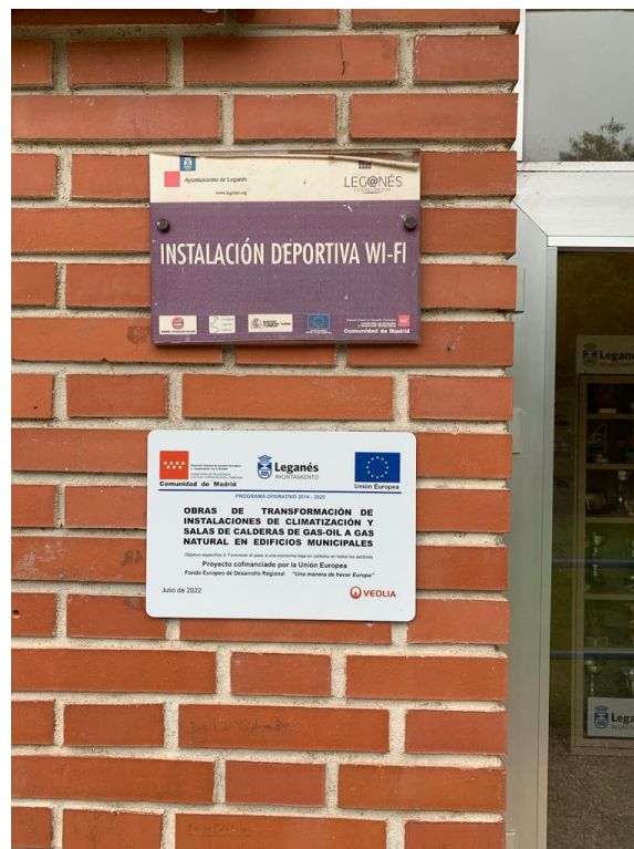
PISCINA EL CARRASCAL

PROYECTO COFINANCIADO POR LA UNION EUROPEA (FEDER)