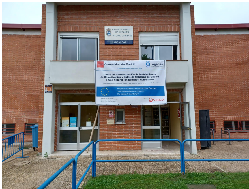
PISCINA EL CARRASCAL