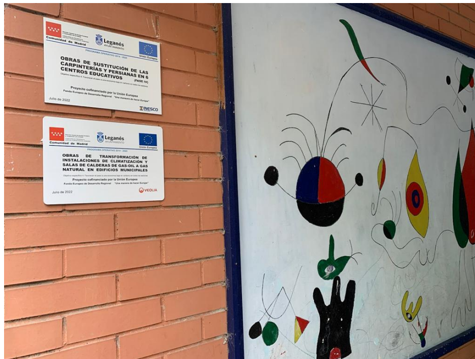
C.E.I.P. JOAN MIRO.