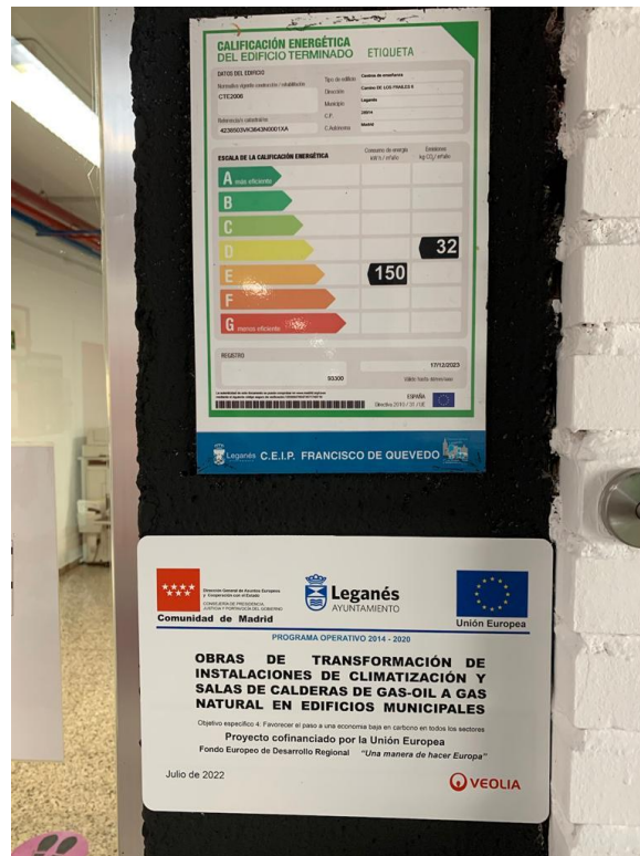
C.E.I.P.FRANCISCO DE QUEVEDO