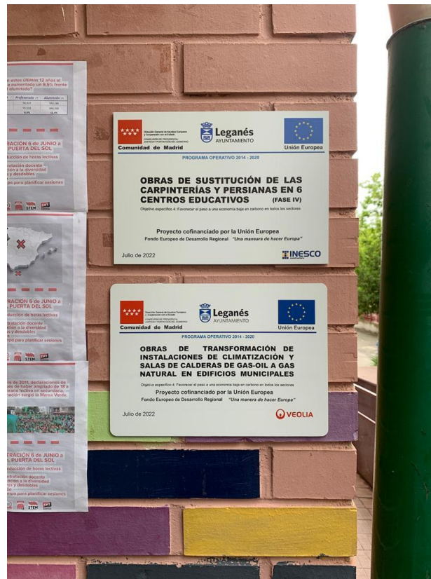
C.E.I.P. MIGUEL DELIBES