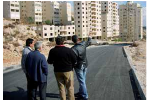
Rehabilitación del barrio Husting Road. Calle Leganés.