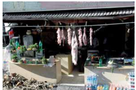
Mercado de Belén