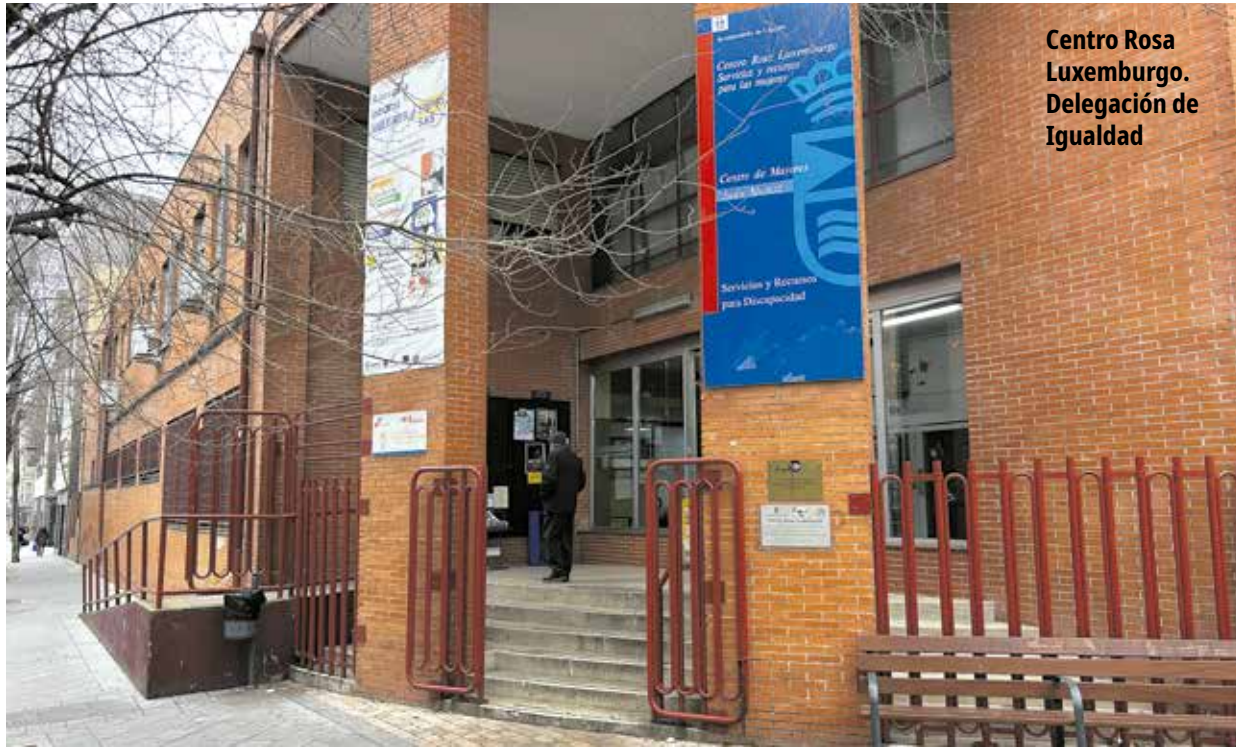
Centro Rosa Luxemburgo. Delegación de Igualdad