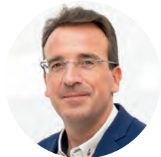
Miguel Ángel Recuenco Checa Alcalde-Presidente