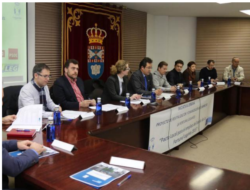
Acto de firma Pacto para el Empleo La Fortuna (Leganés). Salón de Plenos de la Junta Municipal de Distrito de La Fortuna