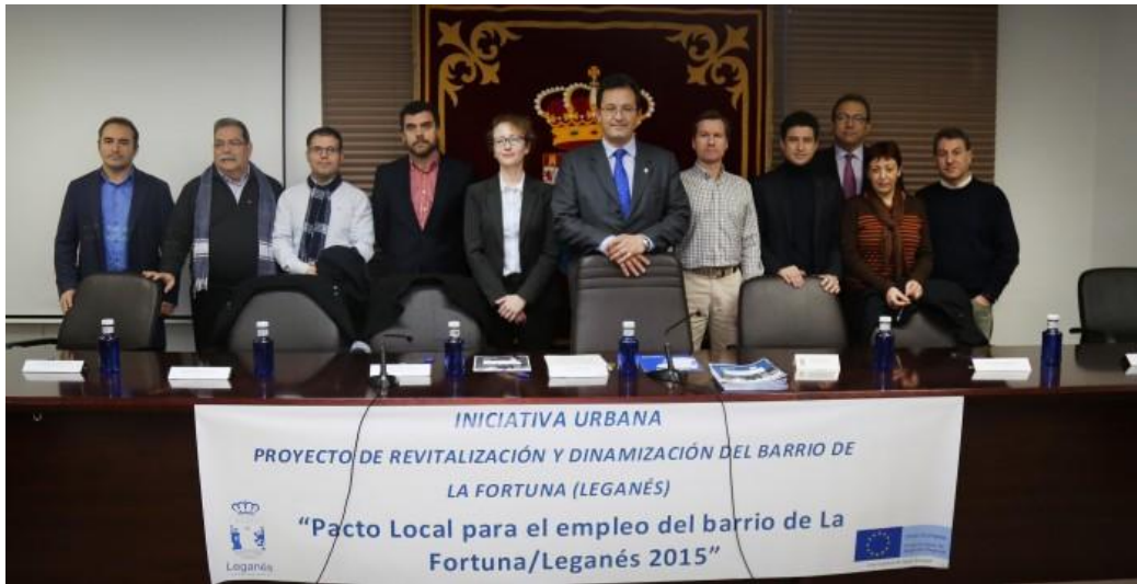
Acto de firma Pacto para el Empleo La Fortuna (Leganés). Salón de Plenos de la Junta Municipal de Distrito de La Fortuna